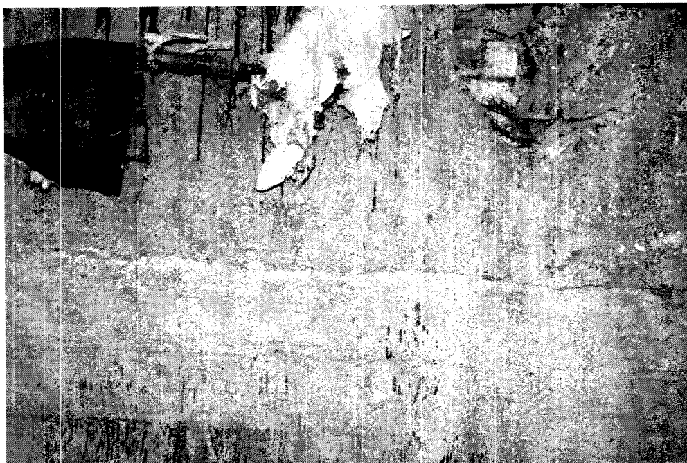
2015-02-11 rūsyje esanti situacija