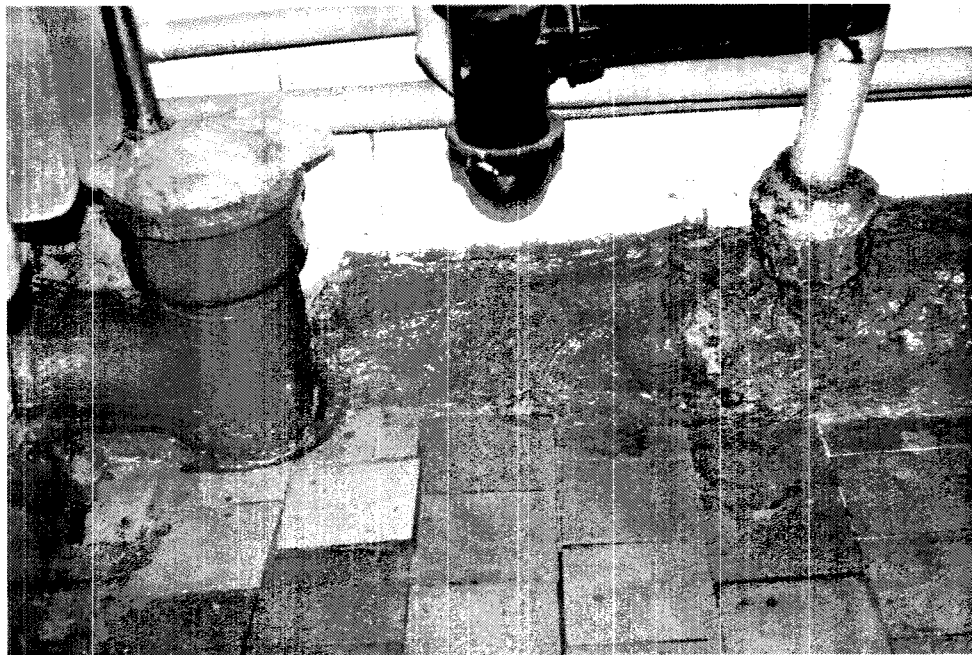
2015-02-11 grupės tualete ir prausykloje esanti situacija